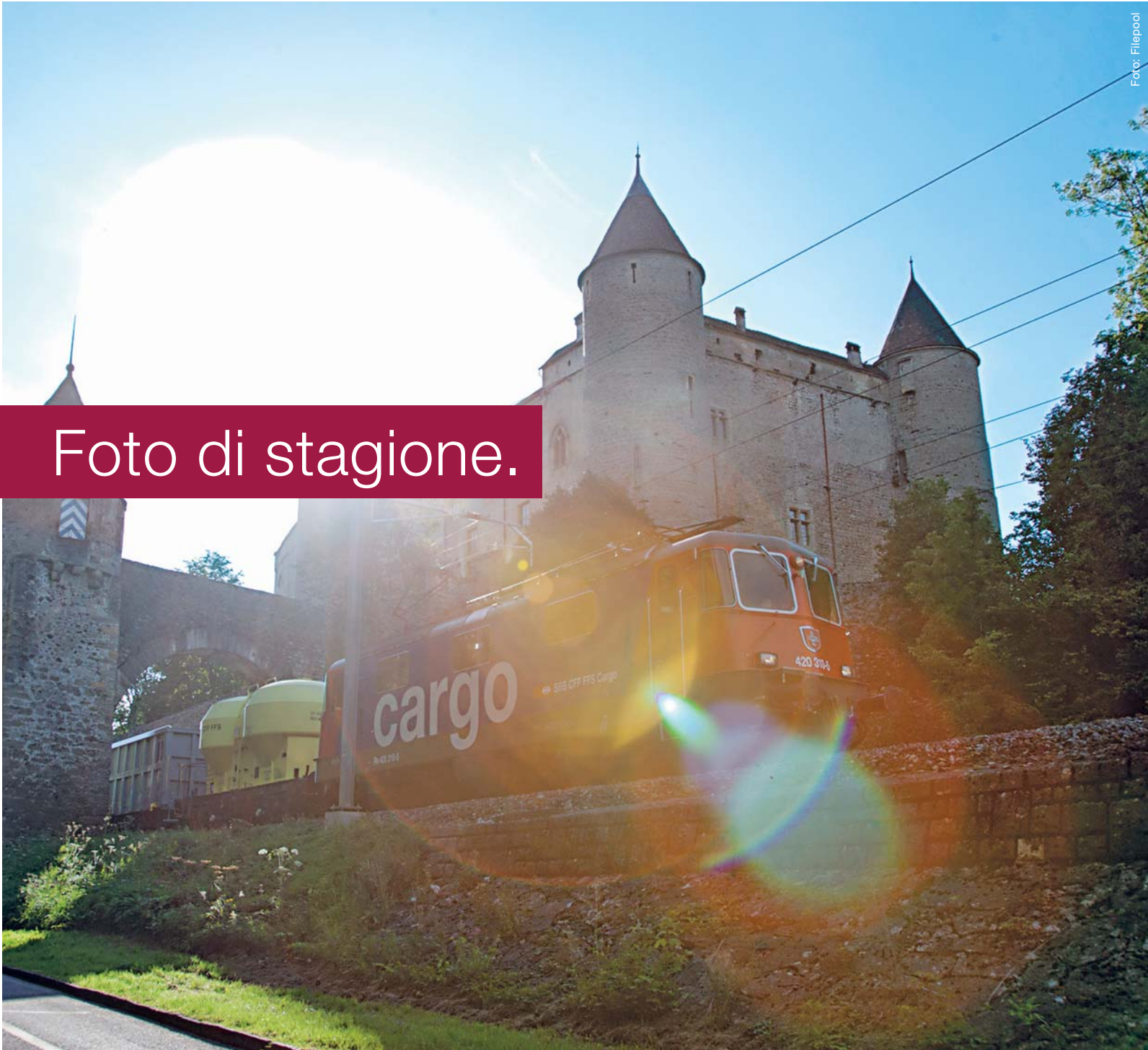
Foto di stagione.