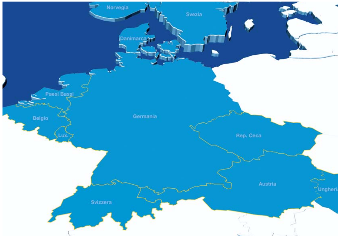
Sette società ferroviarie attive in undici paesi: cartina con le regioni europee servite da Xrail.

«Con Xrail nascerà gradualmente un piano di trasporto europeo fra un binario di raccordo e l'altro», spiega Chantal Schilter. Il committente ha inoltre la possibilità di accedere in qualsiasi momento, via Internet, alle informazioni sullo stato dei suoi trasporti. Eventuali ritardi e il nuovo orario di arrivo previsto vengono comunicati al cliente. Migros, il maggiore cliente di SBB Cargo, è un'altra azienda che punta sistematicamente sulla ferrovia e su SBB Cargo.