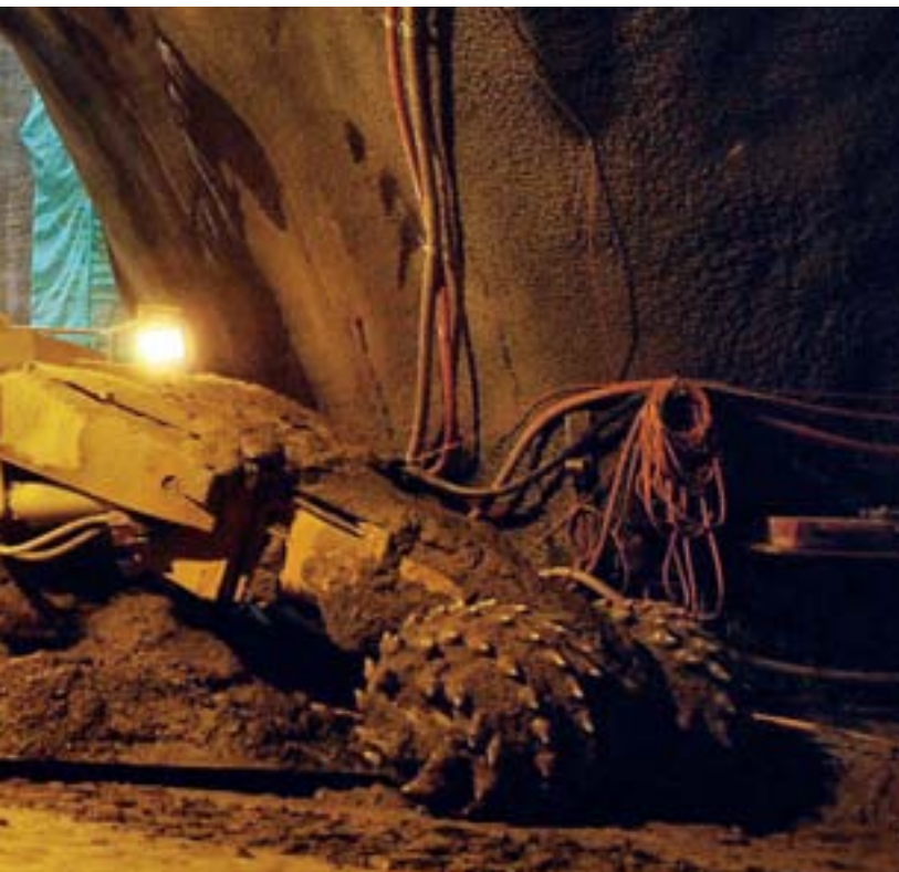
Operazioni di scavo sotto la stazione centrale di Zurigo per una nuova via di transito.

la perforazione con la fresa TBM che produrrà 1,1 milioni di tonnellate di materiale di scavo da portare via con 1400 treni blocco da sedici carri (carri ribaltabili Fans-u), pari a sei o sette coppie di treni al giorno.