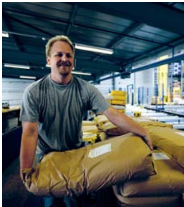
Mangimi per il bestiame svizzero: Ufa, affiliata Fenaco.